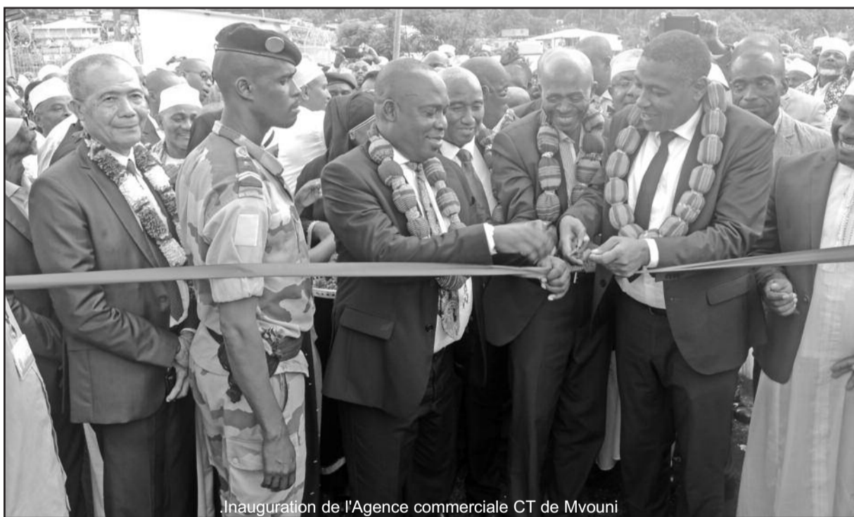
Inauguration de l'Agence commerciale CT de Mvouni