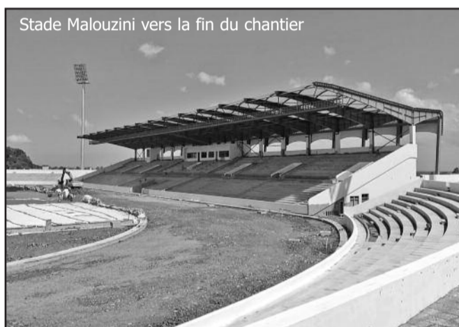
Stade Malouzini vers la fin du chantier

Le chantier de Maluzini bat son plein. La partie comorienne est constituée par deux commissions distinctes : une commission restreinte et une autre élargie. La 2e commission regroupe Monsieur Infrastructure et les mains d'œuvres qualifiées locales, entre autres les techniciens de Comores Télécom, de la société Mamwe et du service habitat pour les bâtiments et les routes. Le programme de Comores Télécom pour les réseaux de communications. « Les opérations pour la mise en place de la lumière et de l'eau le 30 septembre 2018. Depuis le début du chantier, on avait déjà de la lumière et de l'eau ici. Mais, il s'agit d'un raccordement direct avec le stade », développe