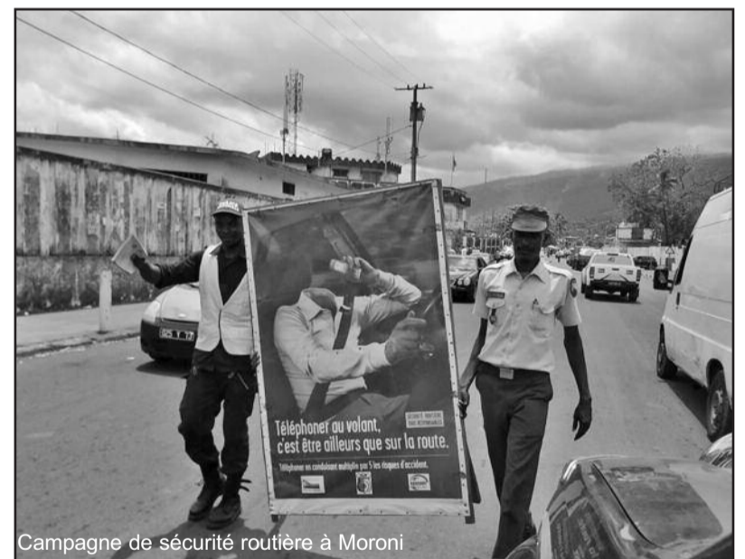
Campagne de sécurité routière à Moroni

comorienne a montré par la suite qu'il y a eu pas mal d'accidents ces derniers temps et espère qu'avec ces nouvelles mesures, cela va nous permettre de réduire le nombre d'accidents », espère-t-il. Du côté des chauffeurs, ils ont accueilli les nouvelles mesures de manière apaisée.